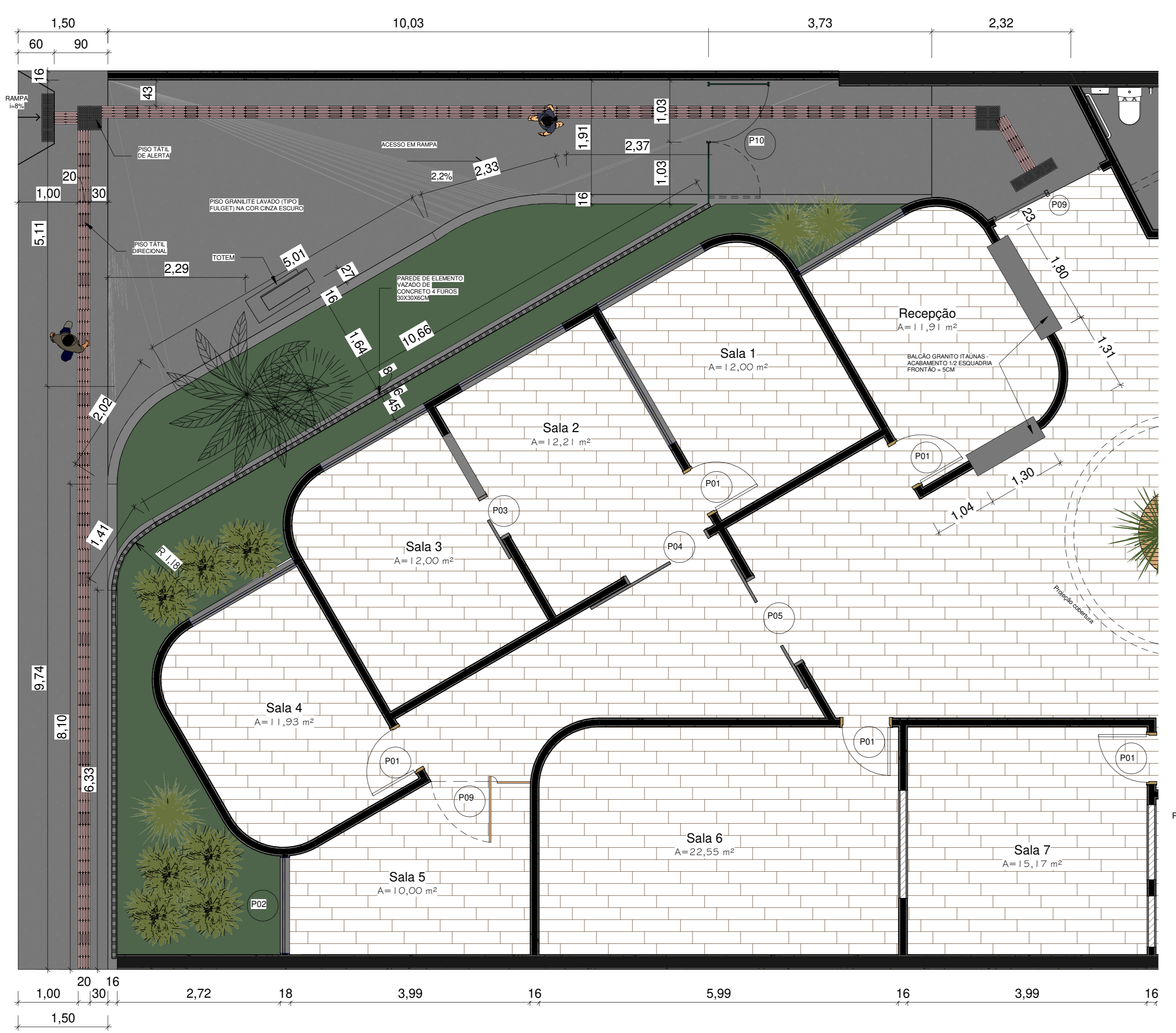
7 PLANTA BAIXA - ACESSO 1 : 50